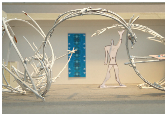
E 1.2, Ausschnitt, 2020