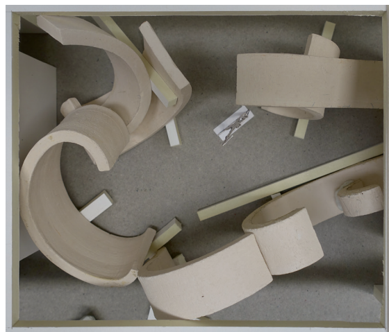
Aufsicht Modell E 1.0, 2020