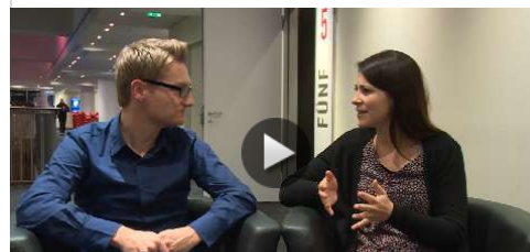
Kinomagazin: "Der Hobbit: Die Schlacht der Fünf Heere"