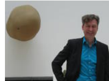
Wolfsburger Museumschef strebt Runderneuerung an