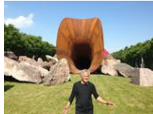
Vagina-Plastik in Versailles löst Proteste aus