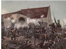
Hannovers große Schlacht