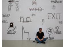
Blick ins Innere der Künstler