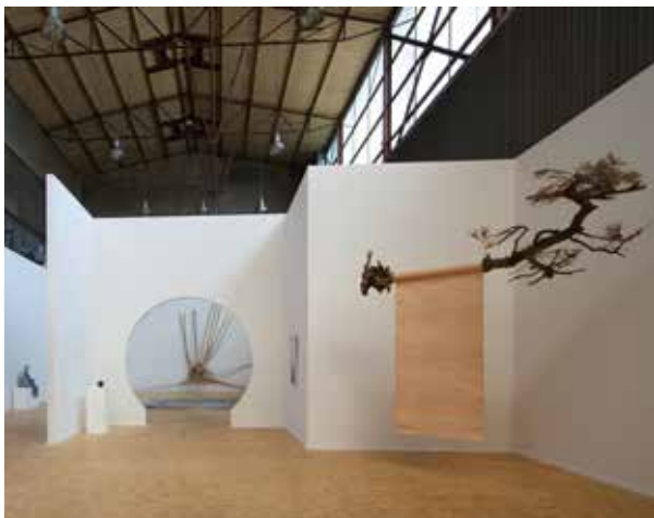
„Sonderausstellung „China Garden - Confronting Anitya“ im Rahmen der Nord Art 2014