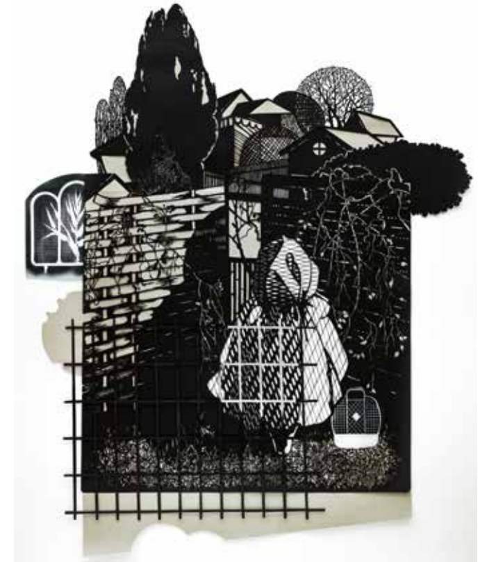
November im Kleingarten, 2021