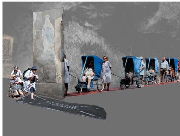
5. "Passage" (Lourde)