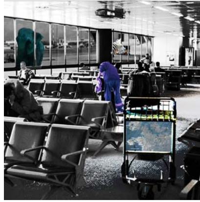
9. "noch nicht dort (2)"