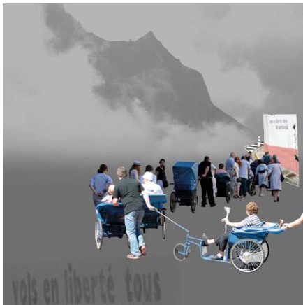
4. "vols en liberté tous les..." (Lourde)