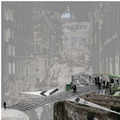
12. "Erzählte Zeit 1" (Rom)