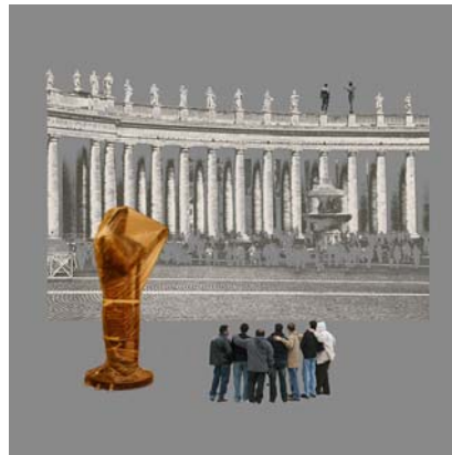
15. "Statuen" (Rom)