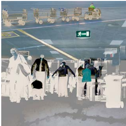
10. "nach etwas anderem suchen (2)"