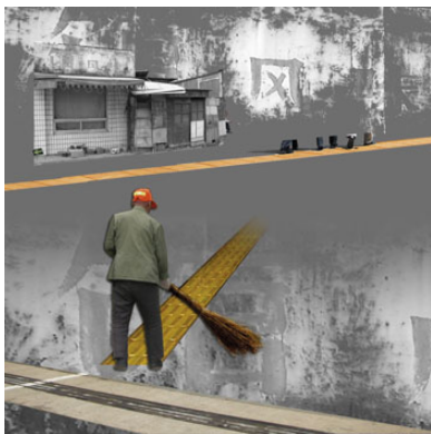
6. "Blindenleitsysteme" (China)