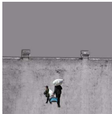
7. "Mauer" (China)