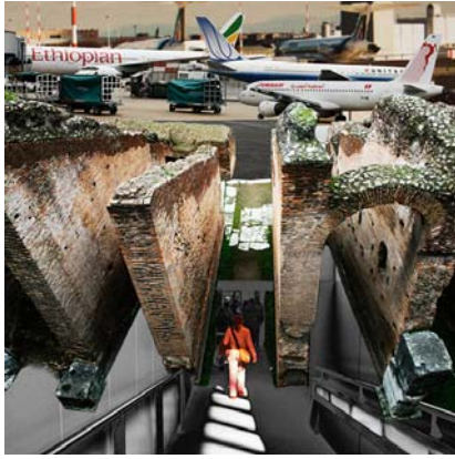
8. "nicht mehr dort (2)"