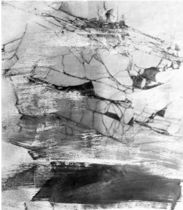
Carrara (Detail), 2008

Zur Eröffnung der Ausstellung am Sonntag, 3. September 2017, 11 Uhr sind Sie und Ihre Freunde herzlich eingeladen