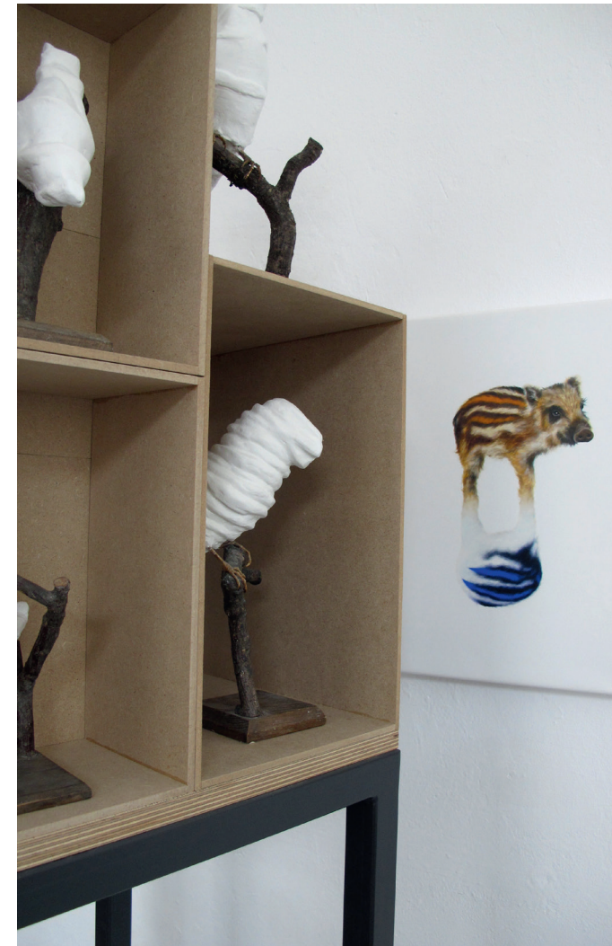
Heffner und Maaß, Installationsansicht, 2021